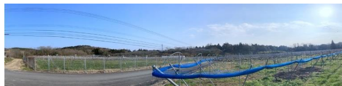
公益社団法人 あじむ農業公社